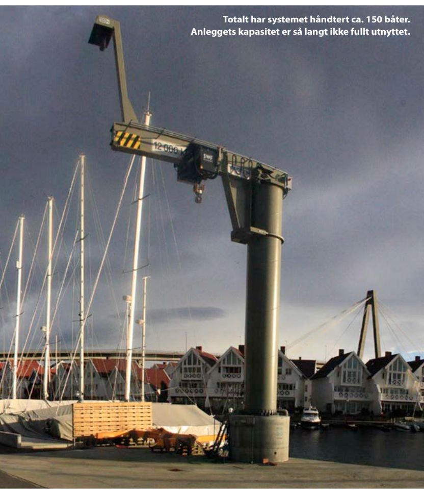
Totalt har systemet håndtert ca. 150 båter. Anleggets kapasitet er så langt ikke fullt utnyttet.