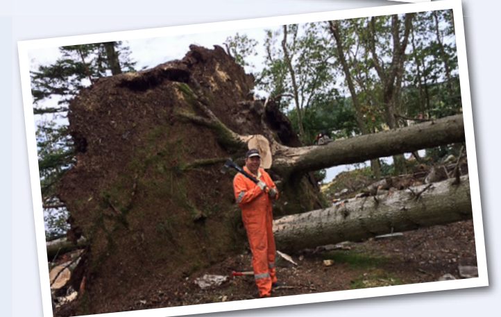
Rotvelt og trefelling på Langøy.