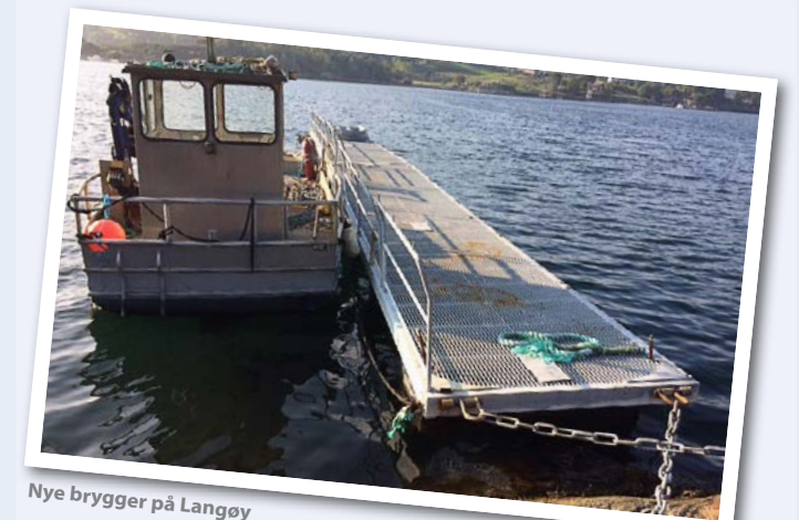
Nye brygger på Langøy