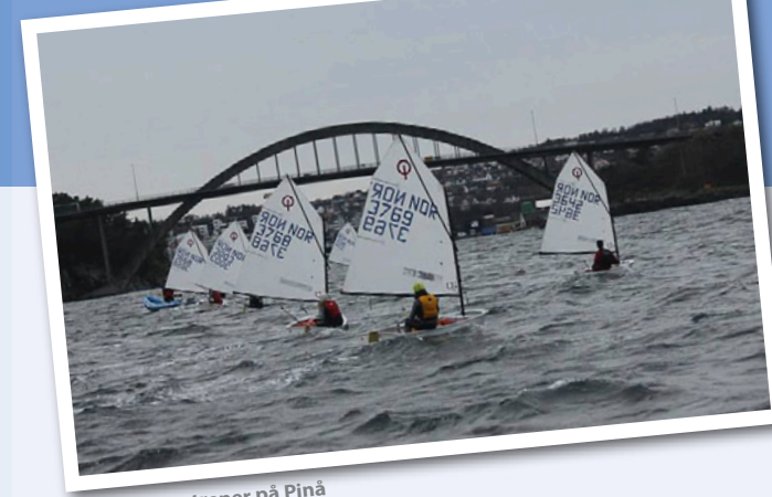
Optimistene trener på Pinå

Noe av det som har forundret og frustrert komiteen for Trening og opplæring mest de siste årene er vanskeligheten med å rekruttere nye barneseilere. De siste årene har vi hatt en dramatisk nedgang i antall introseilere fra rundt 30 til kun 12 i år. Dette til tross for at jolleseiling på mange måter har vært mer synlig enn på lenge både på fjorden og i lokalmedia. Synkende deltakelse på intokurs gir raskt utslag i redusert antall jolleseilere, noe som for alvor viser seg i årets statistikk. Sammenligner vi med befolkningsgrunnet i regionen kan man hevde at Stavanger Seilforening burde hatt atskillig flere barne- og ungdomsseilere, så her har vi en stor utfordring. Det er nedsatt en egen arbeidsgruppe for å tenke nytt i forhold til rekruttering. Bl.a. vil vi forsøke å lære av andre foreninger som har lyktes med dette. Se for øvrig egen sak i Krabben om dette.